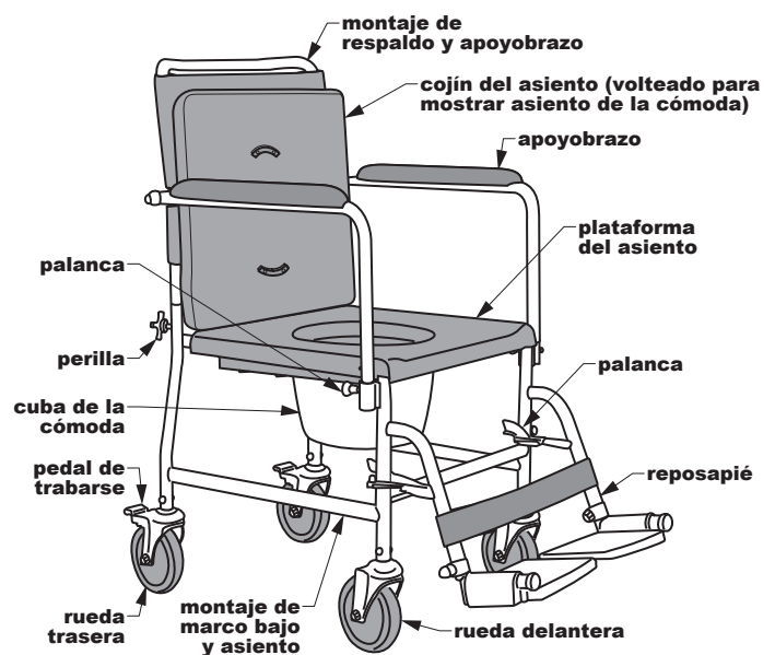
6810A Drop Arm VersaMode

Las ruedas traseras se traban en lugar para prevenir el movimiento. Para trabarse, caminar en el pedal posterior hasta que trabe. Para abrir, caminar en el pedal posterior hasta que abra.